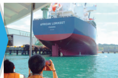
しまなみ海道の絶景を堪能